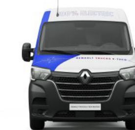
RENAULT TRUCKS MASTER E-TECH