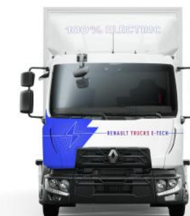
RENAULT TRUCKS D E-TECH