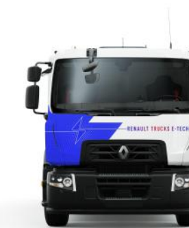
RENAULT TRUCKS D WIDE E-TECH